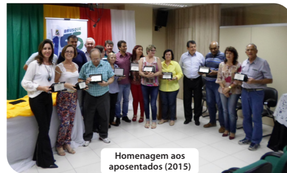
Homenagem aos aposentados (2015)