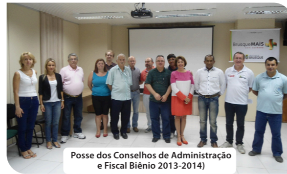
Posse dos Conselhos de Administração e Fiscal Biênio 2013-2014)