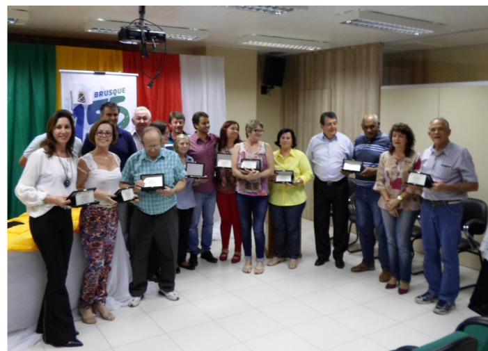
IBPREV completa 12 anos — Página 04