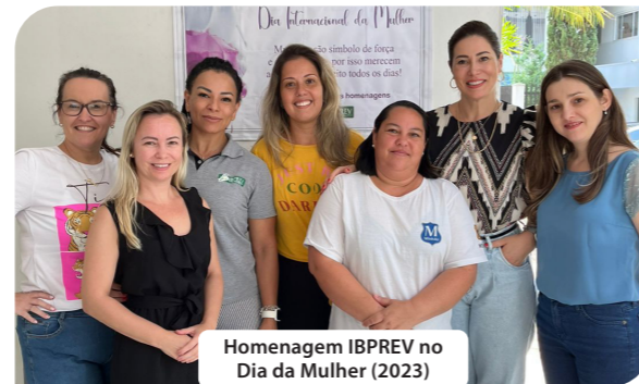
Homenagem IBPREV no Dia da Mulher (2023)