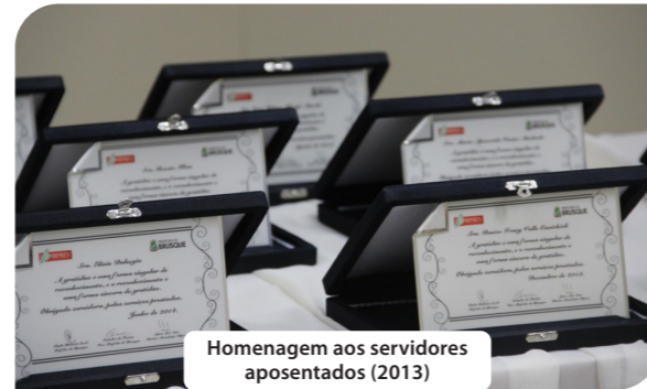
Homenagem aos servidores aposentados (2013)