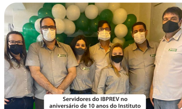
Servidores do IBPREV no aniversário de 10 anos do Instituto