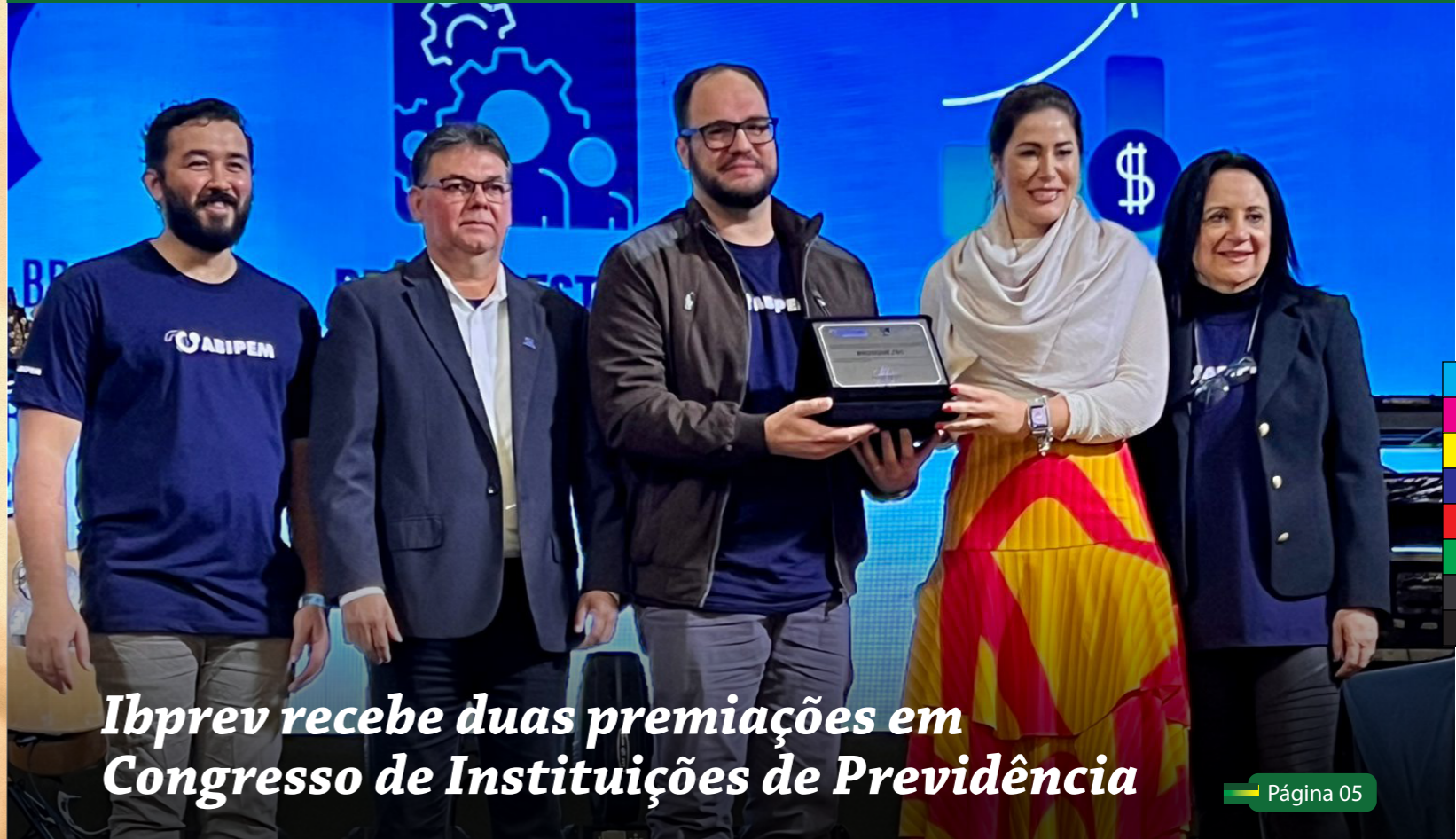
IBprev recebe duas premiações em Congresso de Instituições de Previdência

INFORMATIVO OFICIAL DO INSTITUTO BRUSQUENSE DE PREVIDÊNCIA